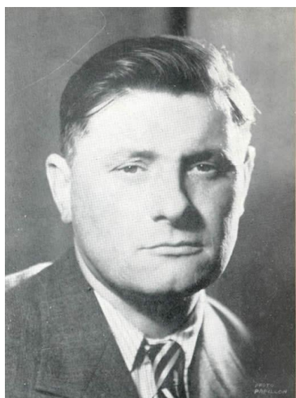
Jean Rogissart en 1937

Jean Rogissart (1894-1961) était un écrivain ( Mervale , Prix Renaudot 1937 ; Le fer et la forêt , Prix du roman populiste en 1941 ; Passantes d'Octobre , Prix Eugène-le-Roy 1958 et la saga familiale et régionale : Les Mamert ) depuis longtemps connu d'Aragon, qui en 1937 avait participé à une soirée en son honneur.